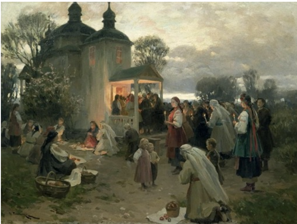
Easter Matins by Mykola Pymonenko, Ukrainian painter (1862-1912)

Procession of Pascha, Paschal Matins, Paschal Divine Liturgy and Blessing of Pascal Baskets in the Church Hall.