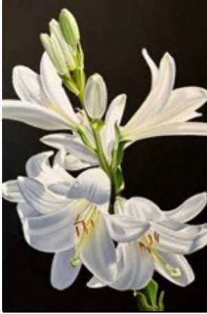
Artist Anastasia Osmolovska

We are collecting donations for flowers for Pascha. Please drop your donations off in the office. Thank you!